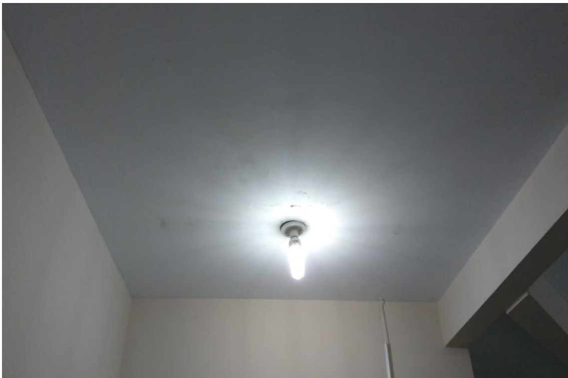
Figura 16 - Luminárias a serem substituídas na UBS Lúcia Elena dos Santos