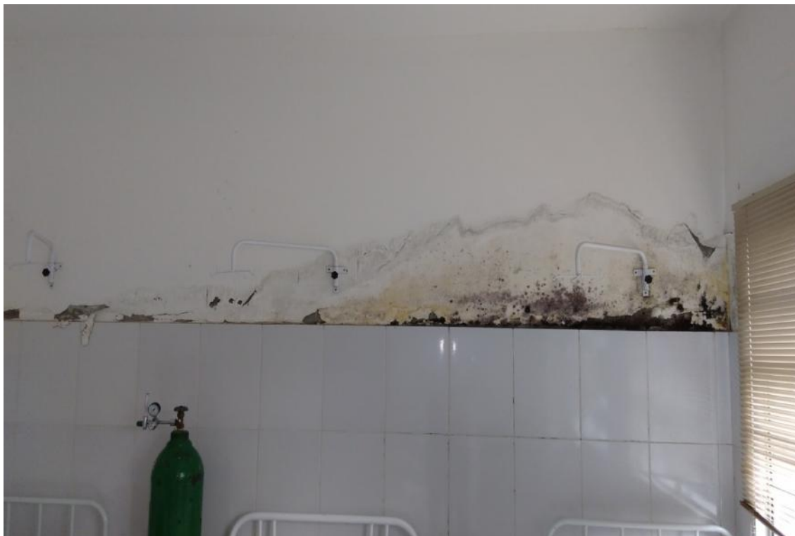
Figura 1 - Manifestações patológicas nas paredes da UBS Lucia Elena dos Santos