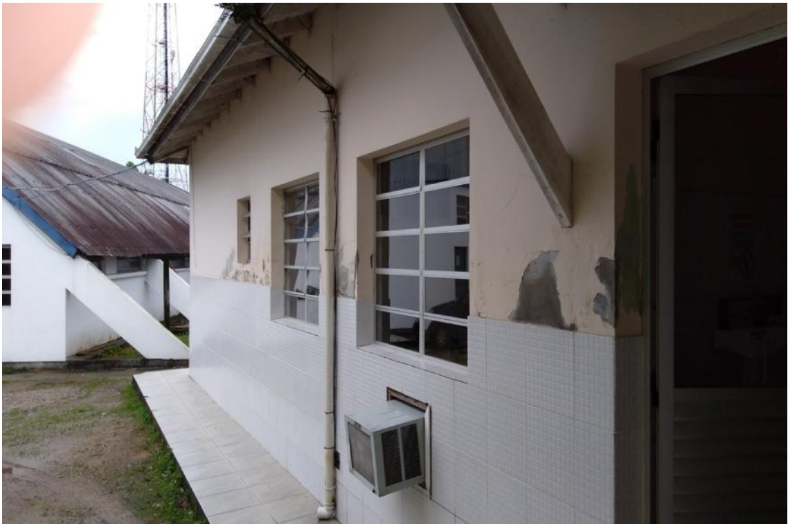
Figura 12 - Calhas e condutores pluviais da UBS Lúcia Elena dos Santos