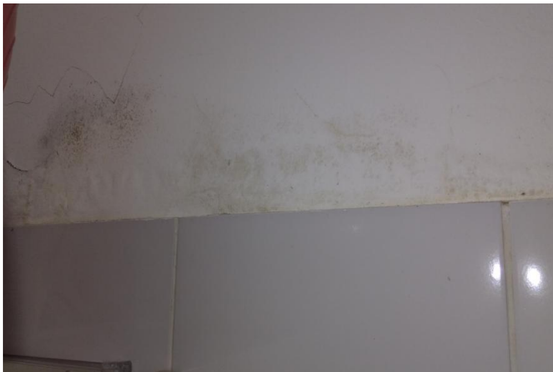
Figura 2 - Manifestações patológicas nas paredes da UBS Lúcia Elena dos Santos