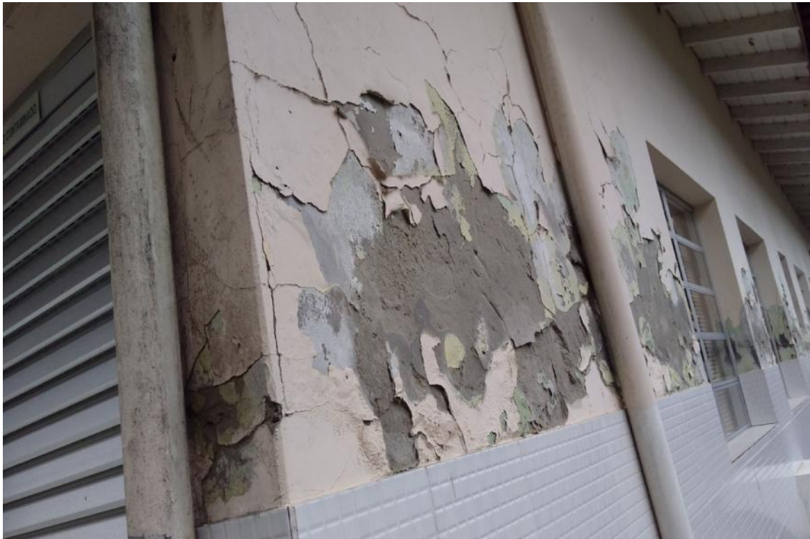
Figura 9 - Manifestações patológicas nas paredes da UBS Lúcia Elena dos Santos