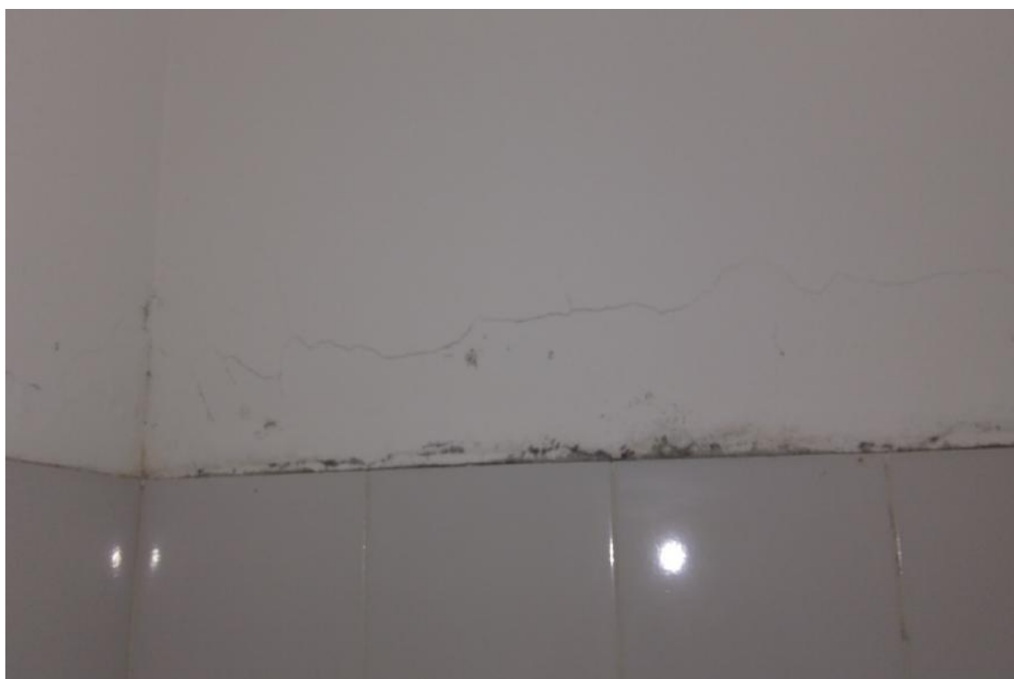
Figura 4 - Manifestações patológicas nas paredes da UBS Lúcia Elena dos Santos