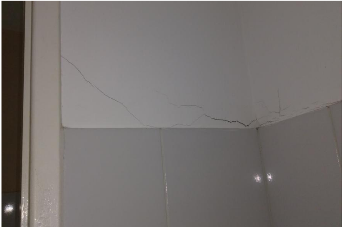
Figura 5 - Manifestações patológicas nas paredes da UBS Lúcia Elena dos Santos