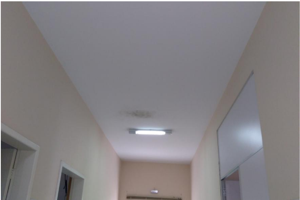
Figura 13 - Manifestações patológicas no teto da UBS Lúcia Elena dos Santos