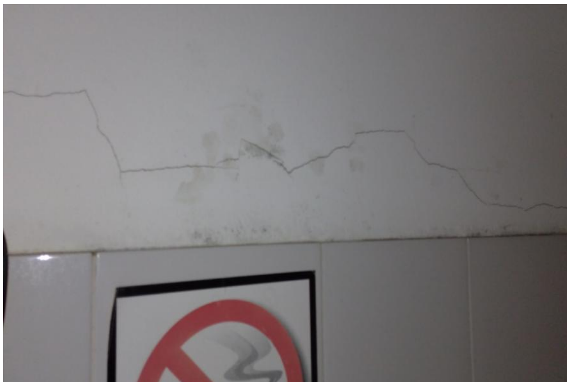
Figura 3 - Manifestações patológicas nas paredes da UBS Lucia Elena dos Santos