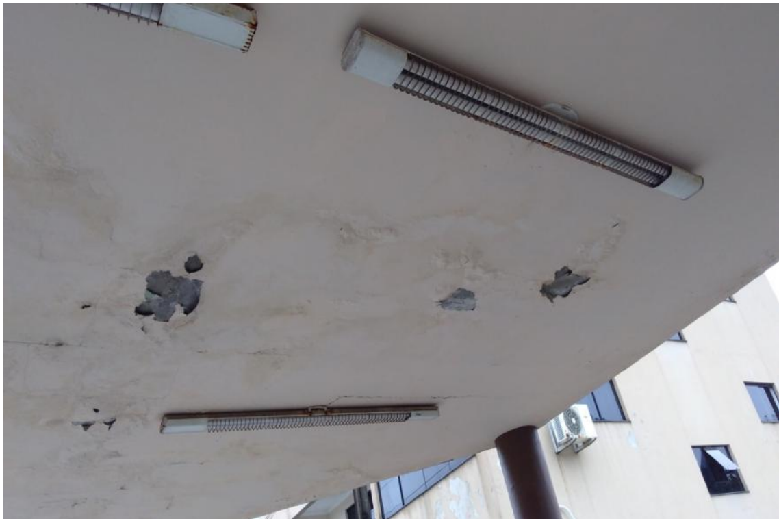
Figura 15 - Manifestações patológicas no teto da UBS Lúcia Elena dos Santos