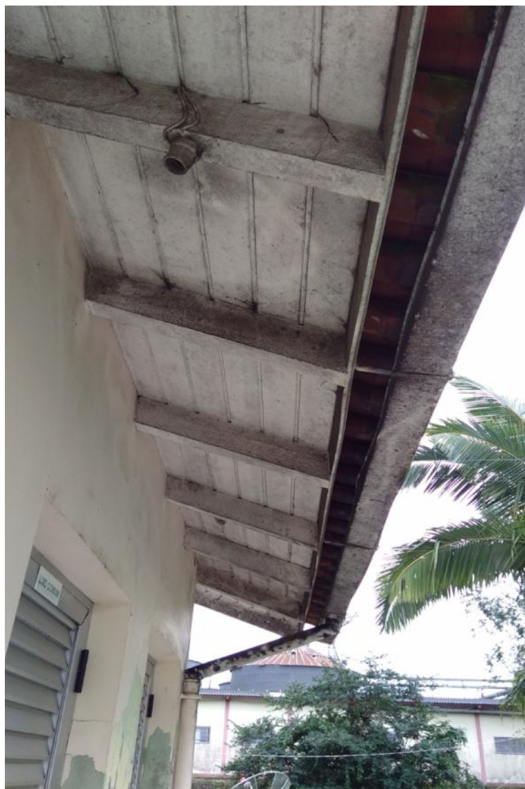
Figura 11 - Manifestações patológicas no forro da edificação