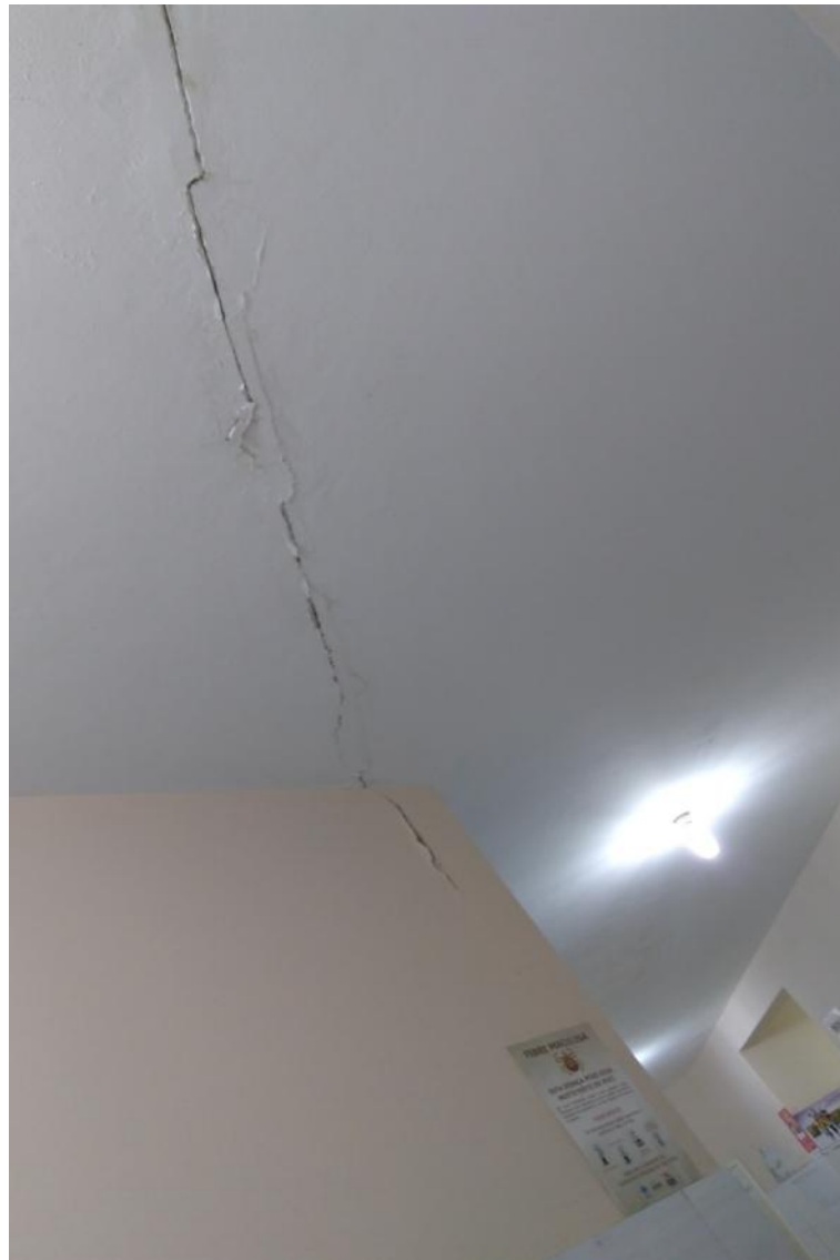
Figura 14 - Manifestações patológicas no teto da UBS Lúcia Elena dos Santos

GOVERNO DO ESTADO DE SANTA CATARINA MUNICÍPIO DE PAULO LOPES SECRETARIA MUNICIPAL DE ADMINISTRAÇÃO