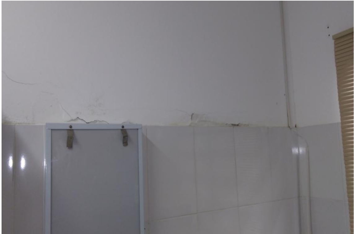
Figura 7 - Manifestações patológicas nas paredes da UBS Lúcia Elena dos Santos