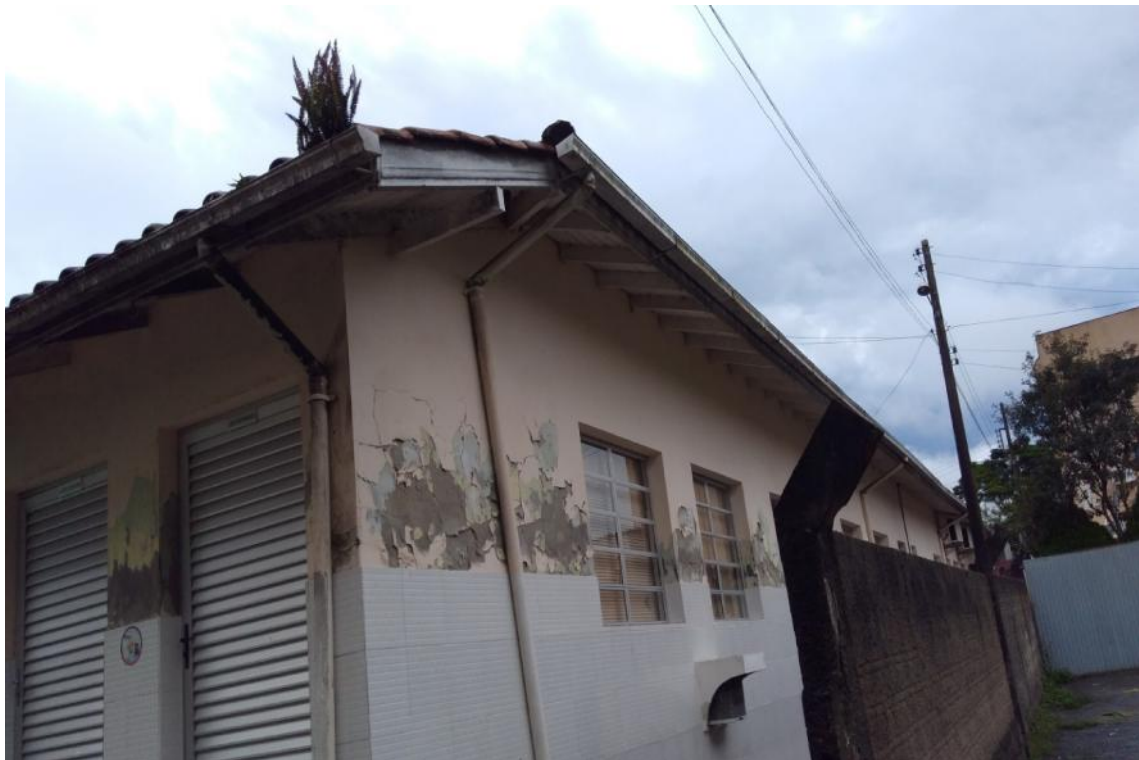
Figura 10 - Manifestações patológicas nas paredes da UBS Lúcia Elena dos Santos