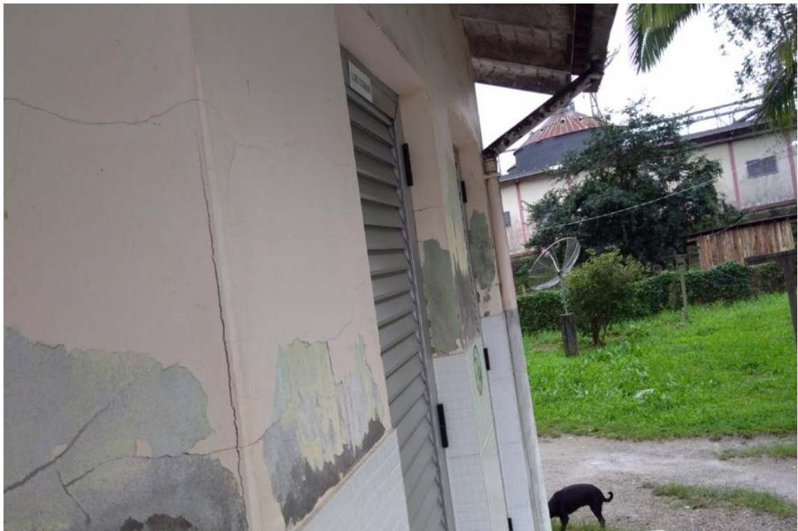
Figura 8 - Manifestações patológicas nas paredes da UBS Lúcia Elena dos Santos