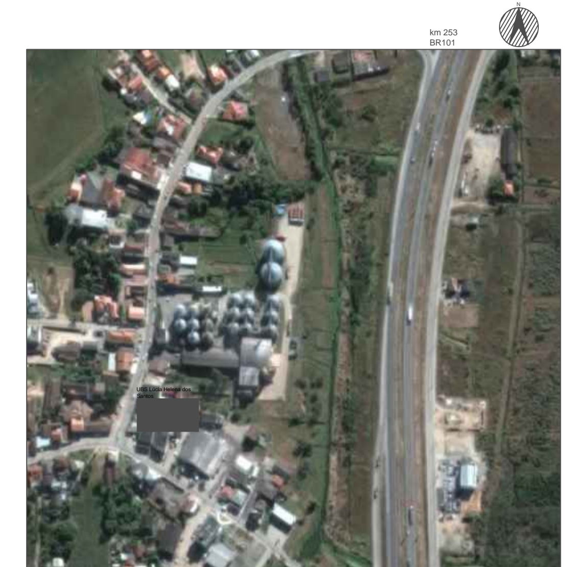
SITUAÇÃO ESCALA 1 : 250